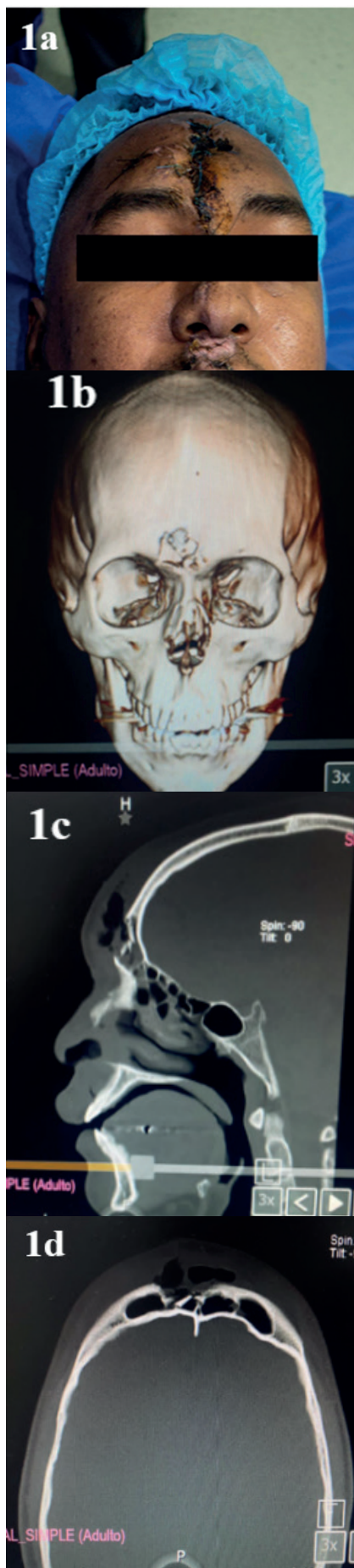
Figura 1 - a) Estado del paciente después del manejo inicial. b) Reconstrucción 3D, vista frontal. c) Vista sagital. d) Vista axial.

A los 7 días de su ingreso bajo anestesia general balanceada se realizó el procedimiento quirúrgico con abordaje por el sitio de la herida, se realizó disección por planos y exposición de fragmentos óseos (Figura 2a). Se verificó el estado del seno frontal, se procedió a realizar limpieza más desnaturalización del seno (Figura 2b). Se realizó reducción más fijación con malla frontal más cinco tornillos de la fractura de la pared anterior del seno frontal derecho (Figura 2c), hemostasia con surgicel y cierre por planos con sutura Vicryl 3-0 y Nylon 4-0 y 6-0 (Figura 2d).