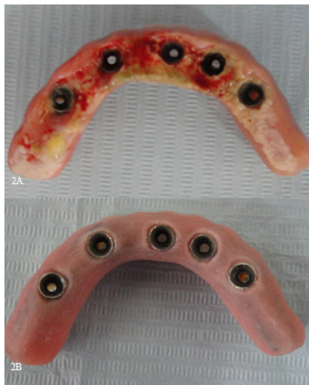
Figura 2A - Vista da superfície protética que fica voltada para o rebordo alveolar remanescente. Observa-se a precipitação de biofilme em sua forma calcificada ao longo de toda a estrutura protética, sinais de sangramento e pus.

A paciente foi acompanhada por 30 dias, comparecendo ao ambulatório com periodicidade semanal para avaliar sua capacidade de higienização e o processo de involução do edema e cicatrização das áreas sangrantes. Na figura 1B, observa-se o aspecto clínico do protocolo em posição no trigésimo dia após início do tratamento da mucosite peri-implantar. Na figura 3B, é evidente o reestabelecimento da coloração normal da mucosa peri-implantar e seu volume original.