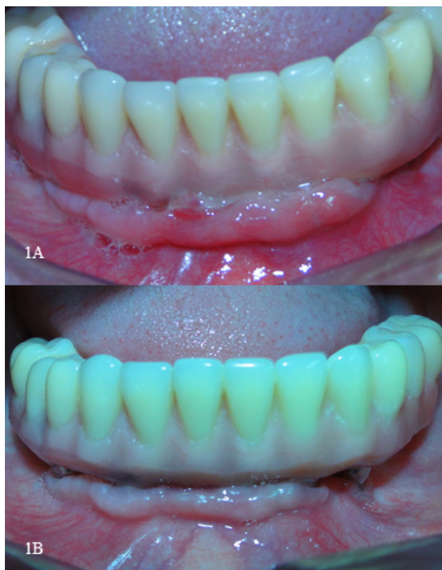
Figura 1A - Exame clínico intraoral: observa-se secreção purulenta e tecido peri-implantar edemaciado, eritematoso e com discreto aumento de volume.

de suporte protético com irrigação copiosa de clorexidina 0,12% diluída em soro fisiológico 0,9% na proporção de 1:1 e movimentos suaves com cureta específica de material sintético.