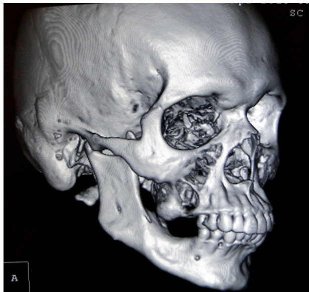
Figura 2: Reconstrução 3D mostrando nitidamente a lesão em maxila.

O paciente foi submetido à biópsia incisional das três lesões. O laudo histopatológico apresentou sugestão diagnóstica de tumor odontogênico ceratocístico para todas as lesões, com epitélio constituído de poucas camadas, com a camada basal em paliça e a camada córnea paraqueratinizada e corrugada.