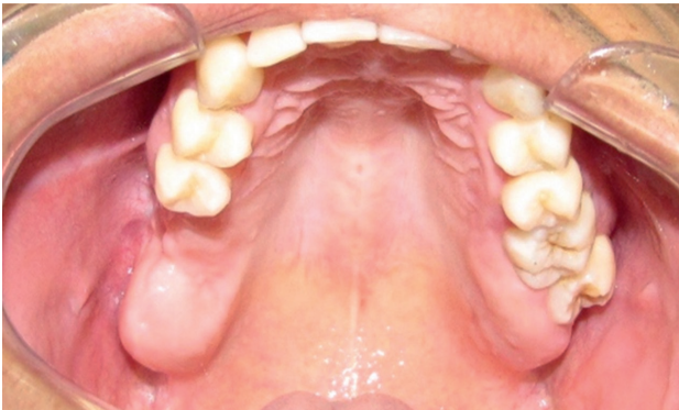
Figura 4: Exame intraoral mostrando o pós-operatório da maxila.

O paciente encontra-se no sexto mês de acompanhamento pós-operatório. Percebe-se, radiograficamente, considerável diminuição no tamanho da lesão da maxila à direita e sinais de reparo ósseo na mandíbula.