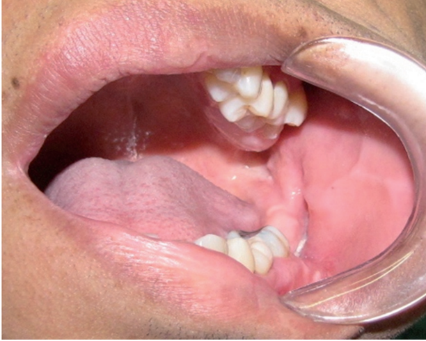
Figura 3: Exame intraoral mostrando o pós-operatório da mandíbula.

a cada cinco dias até o completo fechamento da ferida operatória. Para a lesão localizada na região posterior esquerda da maxila, optou-se por preservação clínica e imaginológica.