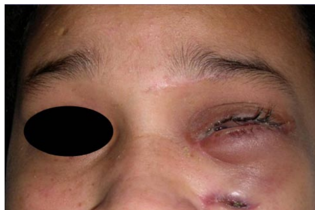
Figura 1 - A: Fotografia da lesão, mostrando o aspecto rugoso e a dimensão considerável desta. B e C: Radiografias mostrando ausência de reabsorção óssea. D: Peça cirúrgica após excisão.

Paciente do gênero feminino, 20 anos, atendida no Centro de Especialidades Odontológicas (Ipojuca/PE) apresentou uma extensa lesão pedunculada, de coloração rósea e superfície rugosa localizada na gengiva lingual, dos elementos dentários 35 ao 45, ocupando parte do assoalho bucal. A lesão tinha evolução, de pelo menos, cinco meses, tendo a paciente dificuldade de fonação e deglutição. Exames complementares de imagem foram realizados, e nenhuma alteração de reabsorção óssea foi encontrada (Figura 1). O tratamento proposto foi a excisão total da lesão com o encaminhamento para exame histopatológico no laboratório do Hospital das Clínicas (UFPE), sendo conclusivo de Granuloma Piogênico. A lesão não recidivou em dois anos de acompanhamento (Figura 2).