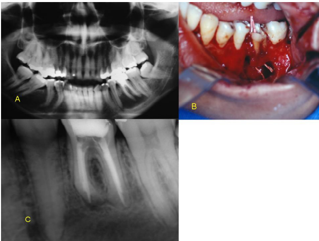
Figura 1A: Radiografia panorâmica mostrando o dente 36 com gigantismo radicular e tratamento endodôntico insatisfatório. 1B: Obturação dos canais radiculares no momento da cirurgia. 1C: Radiografia periapical de 08 meses no qual se observa neoformação óssea completa na região operada.

cirurgia, usando-se cimento Diaket® como cimento endodôntico (Figura 1B). O diagnóstico histopatológico revelou cisto periapical. Já no controle pós-operatório de 07 dias, houve remissão da fístula com ausência de sintomatologia espontânea, não havendo parestesia na região inervada pelo nervo alveolar inferior. O exame radiográfico de 08 meses nos revelou neoformação completa na região operada (Figura 1C).