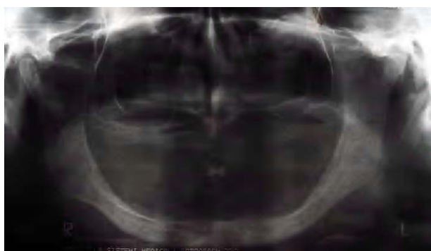
FIGURA 1 - Radiografia panorâmica do pré-operatório, mostrando completo edentulismo e severa atrofia vertical do rebordo alveolar mandibular.

Paciente do sexo feminino, 51 anos, compareceu ao serviço de Cirurgia e Traumatologia Bucodentofacial da Faculdade de Odontologia de Araraquara – UNESP, apresentando severa atrofia do rebordo alveolar mandibular (Figura 1). A paciente era portadora de prótese total superior e inferior, sendo que esta última se apresentava instável, traumatizando a mucosa, o que levou ao aparecimento de uma ulceração no rebordo alveolar (Figura 2).