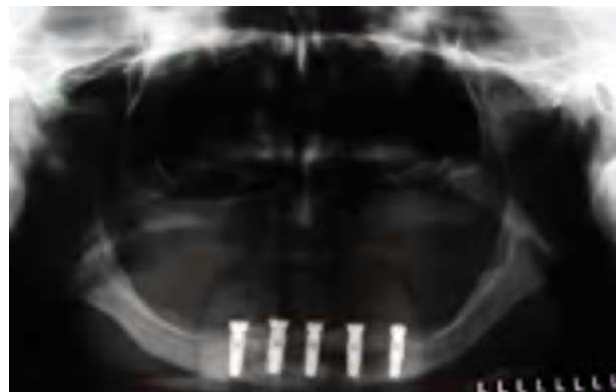
FIGURA 6 - Radiografia panorâmica, mostrando o adequado posicionamento dos implantes.

radiograficamente, um aumento na condensação óssea na área distraída. Após o período de consolidação, o distrator foi removido e, concomitantemente, foram instalados 5 implantes osseointegráveis. Após a instalação dos implantes, foi realizado o preenchimento da área com o osso autógeno retirado da osteotomia para implantes, associado ao osso bovino. A radiografia pós-instalação dos implantes mostra o adequado posicionamento destes bem como um aumento na condensação óssea da área (figura 6).