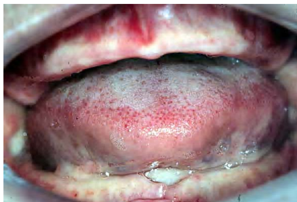
FIGURA 2 - Aspecto clínico da atrofia mandibular, destacando a presença de uma ulceração provocada pelo traumatismo da prótese total inferior sobre o rebordo alveolar.

Na análise facial, observou-se que a paciente apresentava perda de dimensão vertical e um perfil côncavo. O tratamento proposto foi a distração osteogênica da área localizada entre os forames