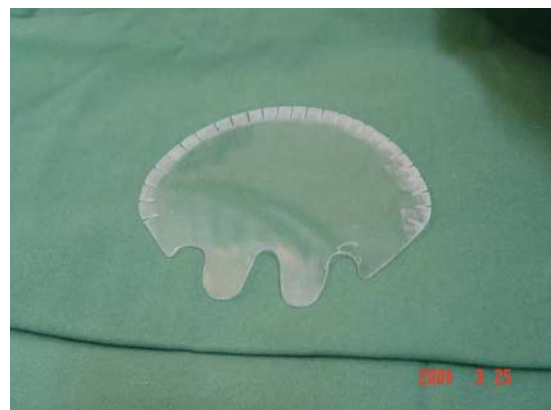
Figura 2 – Mesa de acetato.

Devido aos fatores acima descritos, optou-se por uma intervenção cirúrgica sob anestesia geral, com apoio fonoaudiológico pós-operatório. A glossoplastia foi realizada, utilizando-se a técnica da glossectomia parcial em "V". Para tal, idealizamos um suporte de acetato personalizado para a paciente com a finalidade de acomodar, de forma estática, a língua no transoperatório (Figura 2). A língua foi estabilizada na placa com o auxílio de fios de algodão 2.0 devidamente interpostos nas ranhuras confeccionadas na borda da placa para esse fim (Figura 3).