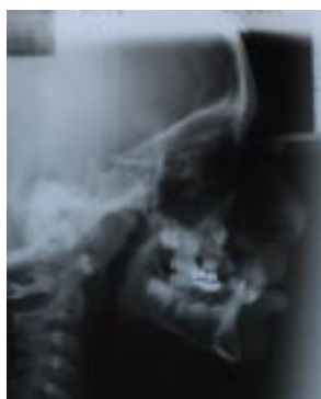
Figura 2 - Teleradiografia de perfil da paciente 01, evidenciando a descontinuidade óssea entre o palato primário e secundário.