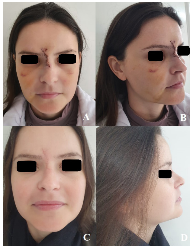
Figura 3 - Acompanhamento pós-operatório. A-B: Acompanhamento após 7 dias do procedimento cirúrgico. Percebe-se a correta inserção do ligamento cantal medial evidenciado pela distância correta intercantal. A projeção e dorso nasal possuíam um adequado posicionamento estético. C-D: Acompanhamento pós-operatório de 4 meses, evidenciando adequada cicatrização local.

bulatoriais a paciente relatou satisfação estética e retorno da permeabilidade nasal bilateral, evoluindo sem queixas álgicas locais e com melhora significativa na cicatrização local, observada até a última consulta (Figura 3C e figura 3D).