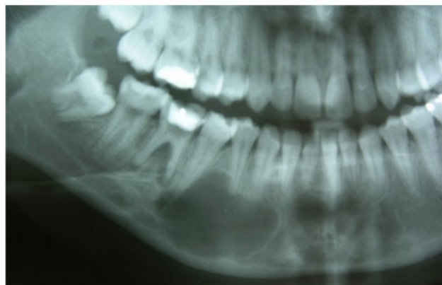
Figura 1 - Radiografia panorâmica 03 anos antes da cirurgia mostrando uma lesão radiolúcida em região de corpo mandibular localizada em periápice das unidades 44, 45 e uma lesão radiolúcida em região parassinfisária à esquerda.

Paciente 22 anos, apresentava duas lesões radiolúcidas em região de parassínfise medindo cerca de 2,5 cm, e em corpo mandibular do lado direito com cerca de 2 cm, compatível com lesões císticas, que foram evidenciadas após exames radiográficos pré tratamento ortodôntico (Figura 1).