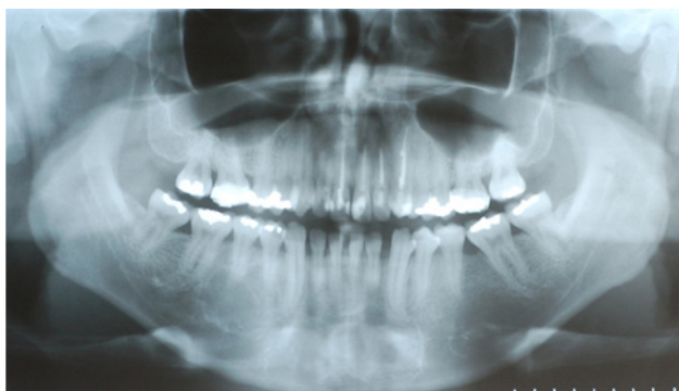
Figura 4 - Radiografia Panorâmica Pós-Operatório de 1 Ano e 07 meses demonstrando neoformação óssea no local das cavidades

O exame radiográfico realizado 02 anos após a cirurgia evidenciavam-se que as áreas das lesões apresentavam neoformação óssea (Figura 4).