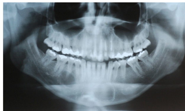
Figura 2 - Radiografia Panorâmica Pré-Operatório, demonstrando aumento de ambas lesões radiolúcidas e projeções entre os ápices das unidades dentárias adjacentes na lesão localizada no corpo mandibular.

Após três anos, novamente indicado pelo ortodontista, o paciente retornou para reavaliação. Ao exame clínico observava-se os mesmos sinais e sintomas descritos anteriormente. Ao exame radiográfico panorâmico foi constatado o aumento da extensão das duas lesões, apresentando cerca de 3,5 cm a cavidade da região de mento, e 3 cm a cavidade da região de corpo mandibular direito (Figura 2). A conduta proposta foi a mesma descrita anteriormente.