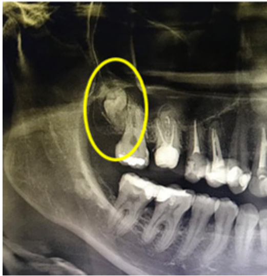
Figura 1 - Radiografia panorâmica evidenciando o terceiro molar superior impactado e invertido.

Foi empregado o protocolo de avaliação pré-operatória instituído na Clínica Escola de Odontologia da UEPB- Campus VIII, partindo de exame clínico, aferição da pressão arterial, consulta quanto à alergias e medicamentos de uso crônico, explicação do procedimento instituído e análise das condições de saúde geral da paciente, que se encontravam dentro do padrão de normalidade para a realização do procedimento.