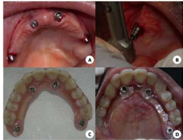
Figura 4. (A) Pilares protéticos em posição na maxila; (B) Instalação do cilindro do mini-pilar protético; (C) Prótese em acrílico implanto-suportada; (D) Prótese provisória instalada.

Todos os implantes instalados apresentaram estabilidade inicial acima de 45 N/cm, tornando viável a carga imediata (Fig.4A), sendo utilizada a prótese total previamente confeccionada como prótese provisória. Dois mini-pilares com 30° CM (cone-morse) e 2 mini-pilares retos CM foram instalados nos implantes com torque de 10 e 32 N/cm, respectivamente. Os mini-pilares angulados foram instalados nos implantes posteriores (Fig.4B), de modo a corrigir a angulação, promovendo o paralelismo dos pilares, de acordo com o planejado. Após 2 horas do início da cirurgia, a prótese foi instalada (Fig.4C;D), promovendo reabilitação ao paciente, com uma prótese total provisória em função imediata (Fig.5A). Ajuste oclusal inicial foi realizado, tomando-se o cuidado de se evitarem contatos nas regiões correspondentes aos cantileveres.