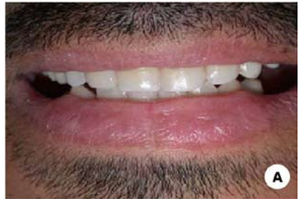
Figura 5. (A) Função e estética imediata.

O paciente encontrando-se sob acompanhamento, apresentou, após a reabilitação oral, satisfação estética e funcional.