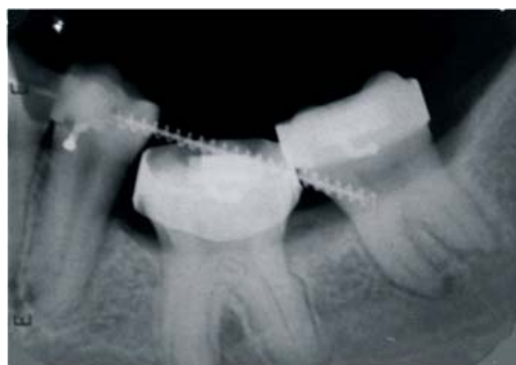
Figura 4 – Risogênese e reparação óssea – 03 anos após a cirurgia.

Passados 03 (três) anos, realizou-se exame clínico, em que ficou constatada a ausência de mobilidade e dor, e exame radiográfico, neste se observando formação radicular e reparação óssea (Figuras 4 e 5).