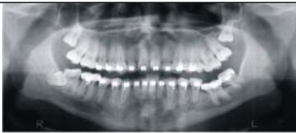
Figura 5 – Radiografia panorâmica realizada 03, anos após a cirurgia.