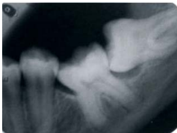
Figura 3 – Erupção espontânea – 03 meses após a cirurgia.

Acompanhamento periódico foi realizado 03 (três) meses após o procedimento cirúrgico, tendo o dente implantado apresentado indícios clínicos e radiográficos de erupção espontânea, o que pode ser observado na Figura 3.